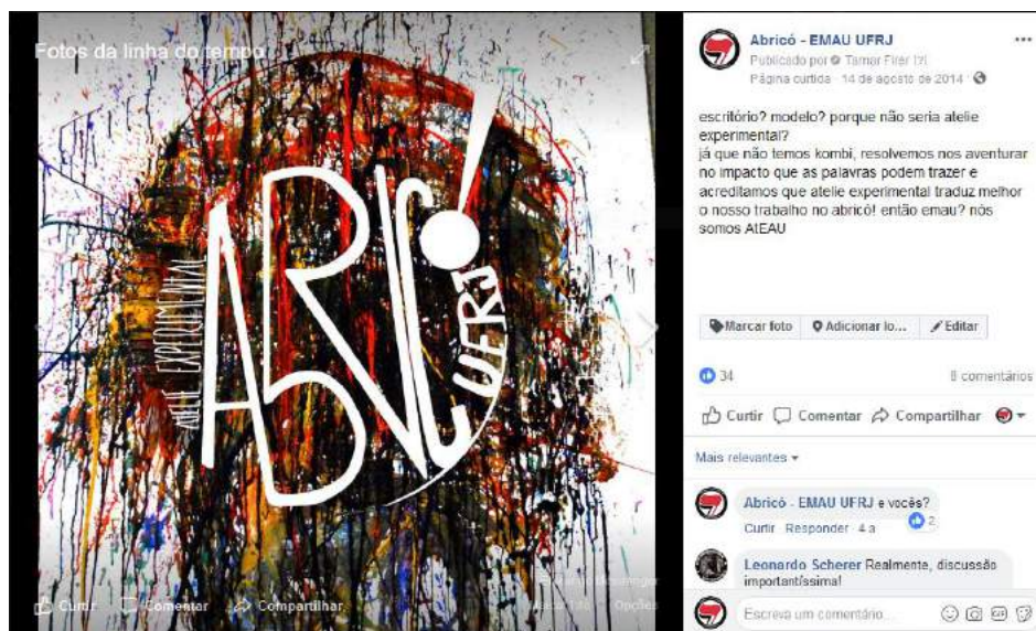
Figura 3: Logo do Abricó e comentários sobre Ateliê Experimental. Fonte: Página do Facebook do Abricó – EMAU UFRJ. Acesso em: 18 nov. 2018