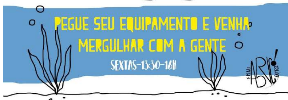
Figura 3: Cartaz de divulgação da Eletiva.

FILMES, TEXTOS, CONVIDADOS E MUITO DEBATE!