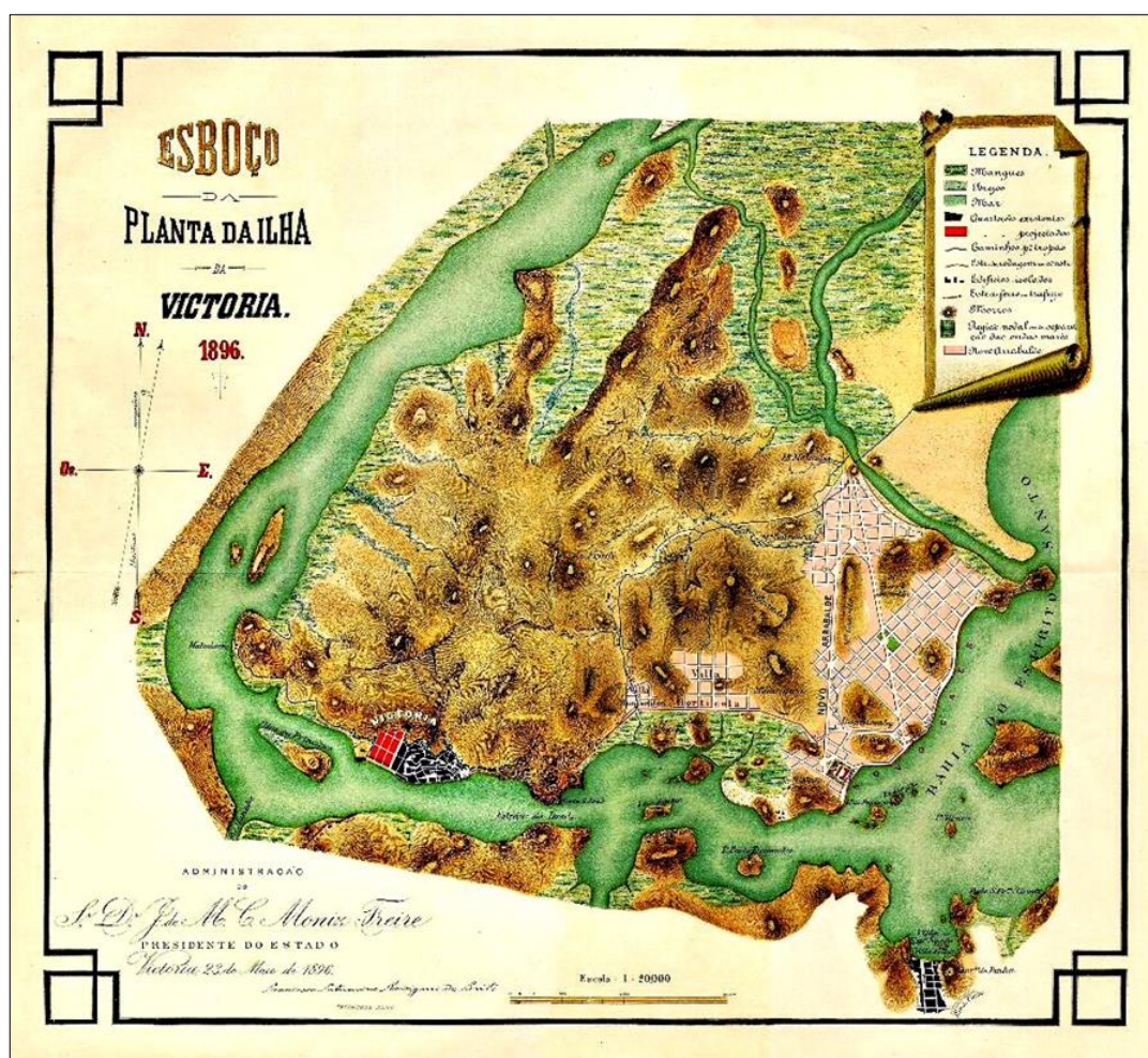
Figura 03: Planta da Ilha de Vitória, 1896. A direita se pode observar o projeto do novo arrabalde para a cidade.

Arrabalde definiu áreas destinadas a hospital, jardins, bosques de eucaliptos, cemitério e capela. Saturnino de Brito elaborou com riqueza de detalhe uma sofisticada proposta de saneamento e de abastecimento d'água, bem como de drenagem acompanhada de aterro. O mesmo projeto ainda propunha medidas complementares, que incluía calçamentos, canais de contornos, limpeza pública de ruas e pátios, transporte e incineração do lixo, entre outras (LEME (coord.), 1999, p. 256-257).