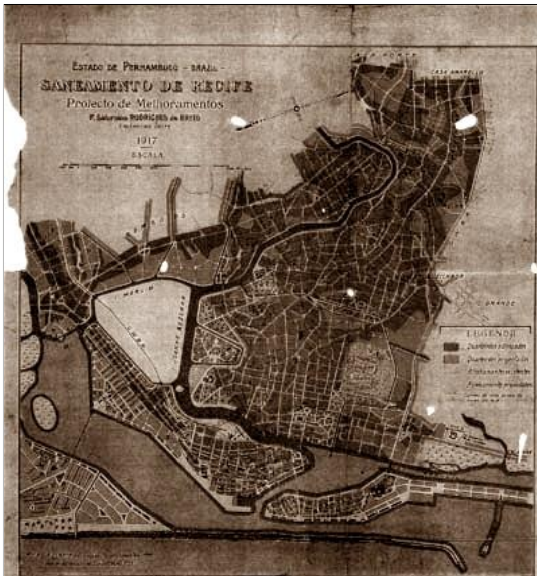
Figura 01: “Saneamento de Recife”, 1917. Projeto de melhoramentos urbanos de Saturnino de Brito para a cidade de Recife.

altimetria do terreno, sendo 9 as estações elevatórias, que recalçariam os esgotos para a usina terminal do sistema. A partir daí era feito o lançamento final no oceano (BURGER, 2008, p. 126).