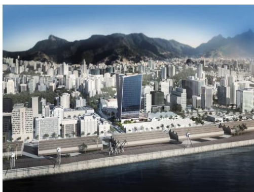
Figura 09: Região Portuária – Pontos Culturais (Fonte: Prefeitura da Cidade do Rio de Janeiro, 2016).

Em um momento de crise financeira, os investimentos não ocorreram como esperado. O quadro atual mostra a existência de grandes regiões urbanas vazias, torres isoladas são vistas na região com pouco uso (ver Figura 09). Sant’anna (2004) acredita que a crise, para o patrimônio, na região portuária, foi benéfica, pois não permitiu que um “paredão” de prédios fosse construído na orla, bloqueando a visão das edificações coloniais preservadas na Sacadura Cabral. A Figura 10 mostra a intenção do projeto original: uma barreira predial bloqueando camadas temporais sobrepostas ao longo de quatro séculos de existência (MEZENTIER, MOREIRA, 2014).