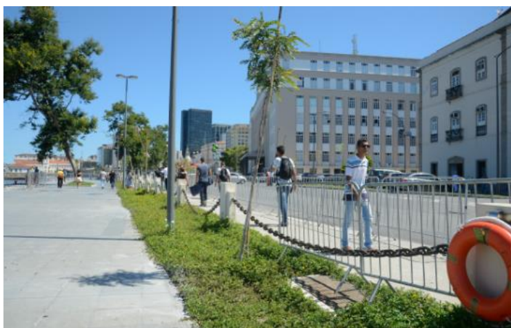
Figura 13: Grades cercando trecho da Orla Conde (Fonte: G1, 2017).

Passada a Olimpíada, a Marinha passou a cercar a orla (ver Figura 13), bloqueando a tão desejada “abertura ao mar”. A justificativa dada pela Marinha era de garantir a segurança dos pedestres, embora até aquele momento, ninguém tivesse caído no mar. Assim, as grades foram instaladas dos dois lados, delimitando a beira do mar e o continente, ampliando no meio esse efeito de “corredor” ou “túnel” que se estende do Museu do Amanhã até os fundos da Casa França-Brasil. Em alguns trechos, as mesas e cadeiras ficaram cercadas e o gramado, inacessível.