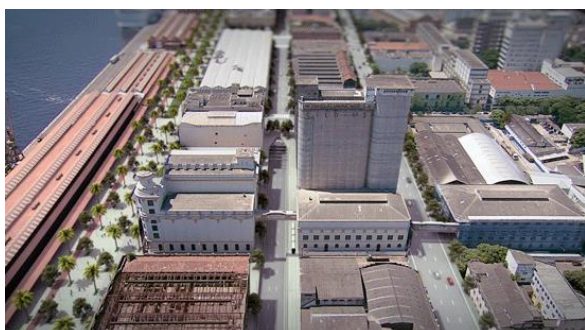
Figura 05: Região Portuária – Via Binário e Orla Conde (Fonte: Adaptado do Projeto Porto Maravilha, Prefeitura da Cidade do Rio de Janeiro, 2017).

Inicialmente, a Perimetral seria demolida até a Praça Mauá, onde o túnel emergiria e a Perimetral continuaria como acesso principal ao Gasômetro, com essa alteração ao projeto original surgiu a Orla Conde (último item acrescentado), ligando a Praça Mauá ao AquaRio (ver Figura 05). O VLT (Veículo Leve sobre Trilhos, ver Figura 06) foi proposto para a região e toda a área central. Como ainda não foram finalizadas todas as suas linhas, é difícil avaliar se seu uso será sucedido ou não. Pois, apenas recentemente foi integrado aos demais modais de transporte. Em reportagem para a Folha de São Paulo, Franco (2017) afirma que o maior movimento de passageiros está no horário entre 11:00 e 15:00 (TARCSAY; CARVALHO, 2018).