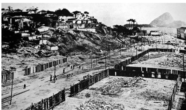
Figura 01 – A abertura da Avenida Central (Fonte: http://multirio.rio.rj.gov.br/index.php/leia/reportagens-artigos/reportagens/469-rio-de-passos-de-tumulo-de-europeu-a-cidade-maravilhosa ).

Na última década do século XIX, existiam dois centros do Rio: aquele com a falta de saneamento, prédios comprimidos em ruas estreitas e variados cortiços e o outro com o glamour da Rua do Ouvidor, a Confeitaria Colombo, exemplos marcantes das fortes influências inglesas e francesas. A primeira maior intervenção feita na região portuária do Rio foi no governo de Pereira Passos, e para a época, a rapidez das obras impressionou. Abaixo encontram-se listados suas modificações mais marcantes: bonde elétrico – transporte de massa mais sofisticado; benfeitorias em diversas praças da cidade com a implantação de estátuas imponentes e/ou jardins melhorados; arborização das ruas do Centro, Botafogo e Laranjeiras; pavilhões arquitetônicos; construção do Teatro Municipal, Túnel do Leme (04/03/1906) – Copacabana integrada; saneamento e higiene: canalização dos rios. Laranjeiras e Flamengo (Rio Carioca); demolição dos cortiços, proibição dos ambulantes e mendicância; abertura da Avenida Central (atual Rio Branco) (ver Figuras 01, 02 e 03); e aterros da Francisco Bicalho e Rodrigues Alves (ABREU, 2003).