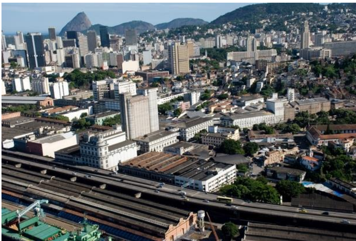
Figura 04: Região Portuária antes da Intervenção (Fonte: Antigas Imagens Aéreas do Google – acervo pessoal).

Inicialmente, a Perimetral seria demolida até a Praça Mauá, onde o túnel emergiria e a Perimetral continuaria como acesso principal ao Gasômetro, com essa alteração ao projeto original surgiu a Orla Conde (último item acrescentado), ligando a Praça Mauá ao AquaRio (ver Figura 05). O VLT (Veículo Leve sobre Trilhos, ver Figura 06) foi proposto para a região e toda a área central. Como ainda não foram finalizadas todas as suas linhas, é difícil avaliar se seu uso será sucedido ou não. Pois, apenas recentemente foi integrado aos demais modais de transporte. Em reportagem para a Folha de São Paulo, Franco (2017) afirma que o maior movimento de passageiros está no horário entre 11:00 e 15:00 (TARCSAY; CARVALHO, 2018).