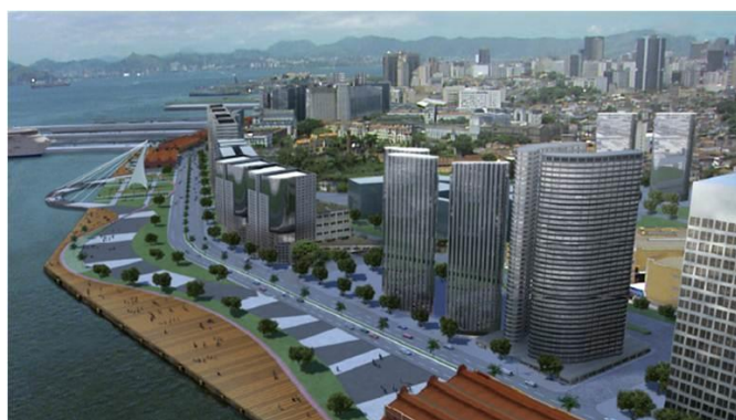
Figura 10: Região Portuária – projeto Porto Cidade.