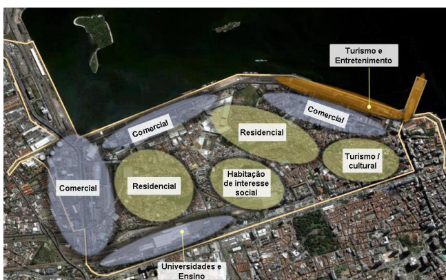
Figura 07: Imagem com as definições de uso do projeto da Zona Portuária (Fonte: Adaptado de Projeto Porto Maravilha, Prefeitura da Cidade do Rio de Janeiro, 2010).

A região, apesar de ser setorizada em tipos de uso, como visto na Figura 07, apresenta diversas implantações de monumentos voltados para a atração turística, como o MAR (Museu de Arte do Rio), Museu do Amanhã, AquaRio, entre outros (ver Figura 08). Sem o incentivo adequado para os outros tipos de uso, como comercial, residencial e social, não são criadas ligações que moldam o espaço, os usos e os relacionamentos variados. Acreditavam-se que os Cepacs (Certificados de Potencial Adicional de Construção) ofereceriam estímulo ao setor privado para que investissem na região. Um Cepac varia conforme tipo de uso e setorização. Até o momento, o projeto de habitação social para a área portuária não apresenta planos financeiros que garantam sua execução.