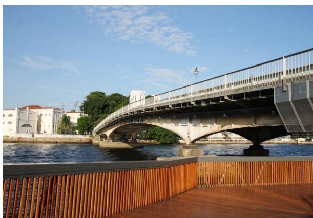
Figura 11: Trecho da ponte permite contemplar prédios históricos como o Arsenal da Marinha na Ilha das Cobras.