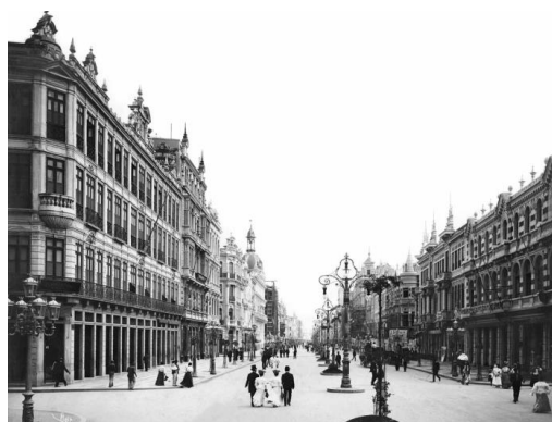
Figura 02 – Avenida Central, logo após a reforma Pereira Passos.