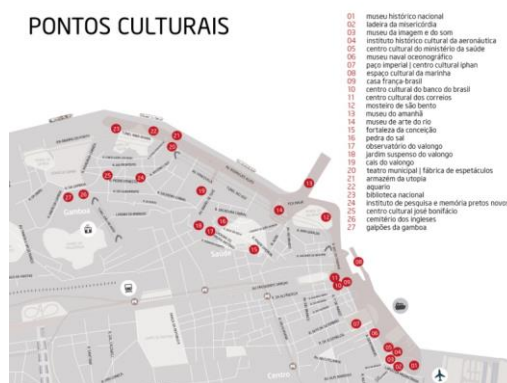
Figura 08: Região Portuária – Pontos Culturais.

Em um momento de crise financeira, os investimentos não ocorreram como esperado. O quadro atual mostra a existência de grandes regiões urbanas vazias, torres isoladas são vistas na região com pouco uso (ver Figura 09). Sant’anna (2004) acredita que a crise, para o patrimônio, na região portuária, foi benéfica, pois não permitiu que um “paredão” de prédios fosse construído na orla, bloqueando a visão das edificações coloniais preservadas na Sacadura Cabral. A Figura 10 mostra a intenção do projeto original: uma barreira predial bloqueando camadas temporais sobrepostas ao longo de quatro séculos de existência (MEZENTIER, MOREIRA, 2014).