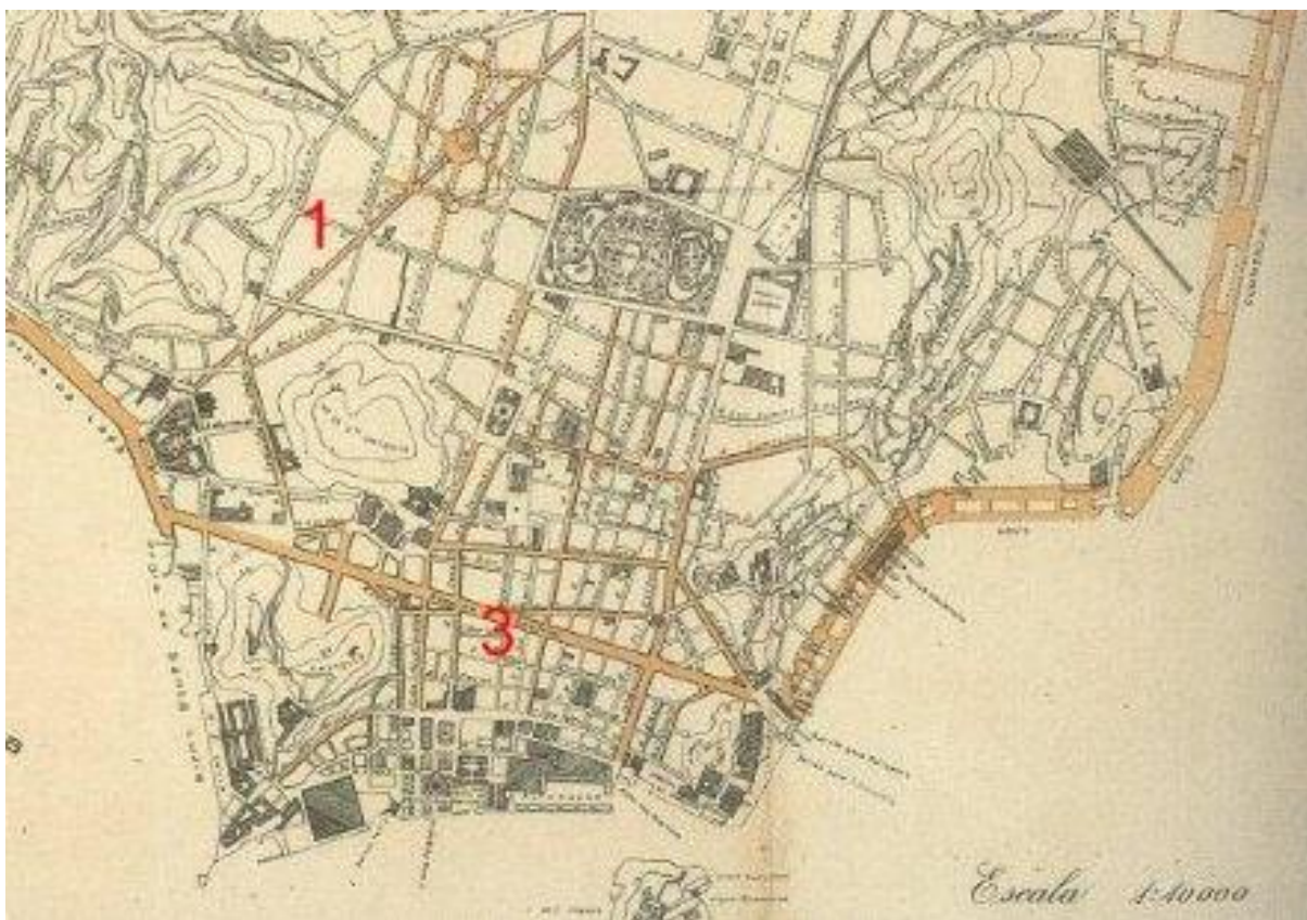
Figura 03 – Traçados da reforma de Pereira Passos

As transformações urbanísticas de Pereira Passos no Porto caracterizaram-se pelo extenso aterro com uma nova estrutura viária, deslocamento da operação para o Caju, com pontos de atracação centralizados e estrutura bem mais moderna, conhecido como Cais da Gamboa (RABHA, 2006).