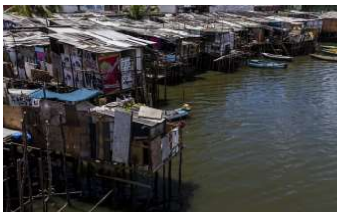
Figura 2: Bairro de palafitas, Recife.

Em cidades litorâneas como Recife, Rio de Janeiro e Florianópolis, é bastante visível a tendência de verticalização na orla dessas localidades. Ambientalmente, a cidade que sofre com o barramento de sua parte costeira se torna menos ventilada, afetando diretamente a qualidade de vida da população pelos impactos ambientais causados. Apesar do adensamento possibilitar o acúmulo de atividades e redução de deslocamentos, a cidade real no contexto se faz totalmente alheia à essa dinâmica. As redes de hotelaria e atividades relacionadas às praias são alimentadas por funcionários residentes de áreas afastadas do centro desenvolvidor, localizadas em ambientes de grande fragilidade social e ambiental.