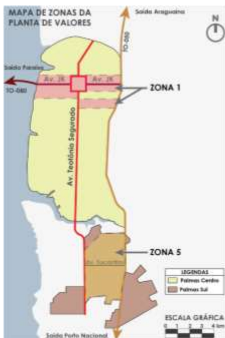
Figura 7: Mapa de Zonas da Planta de Valores