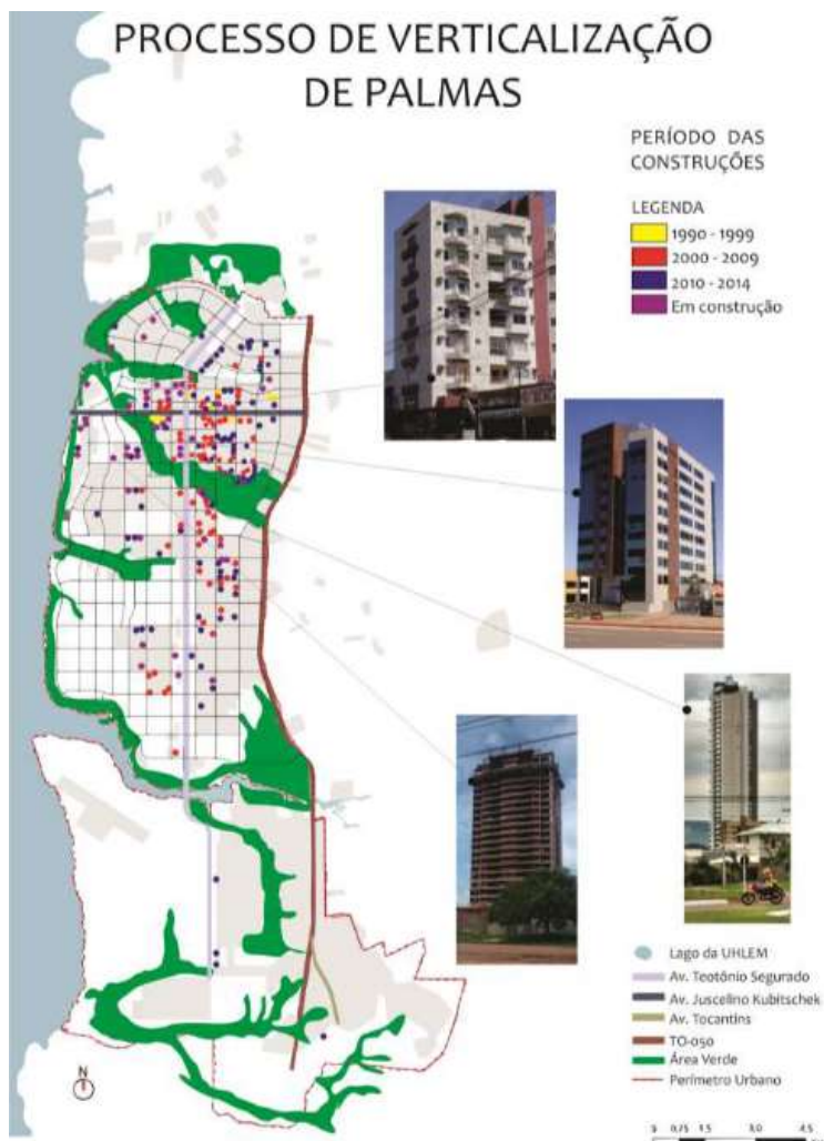
Figura 6: Mapa do processo de verticalização em Palmas.