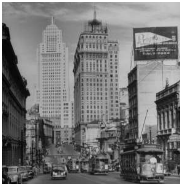
Figura 1: Verticalização em São Paulo na década de 1940

população de baixa renda a áreas mais densas e ambientalmente vulneráveis, pois os custos de se obter a propriedade eram consideravelmente menores.