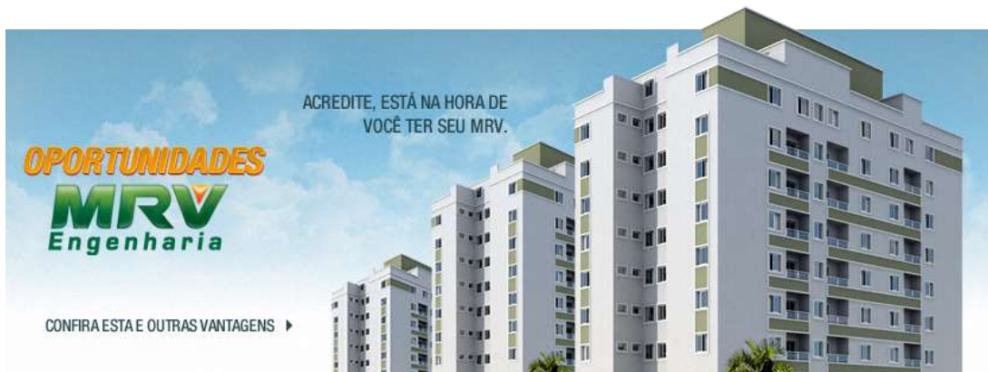
Figura 3: Folder de divulgação MRV Engenharia.

constam no site da própria construtora, 1 a cada 200 brasileiros vive em um dos empreendimentos da MRV Engenharia.