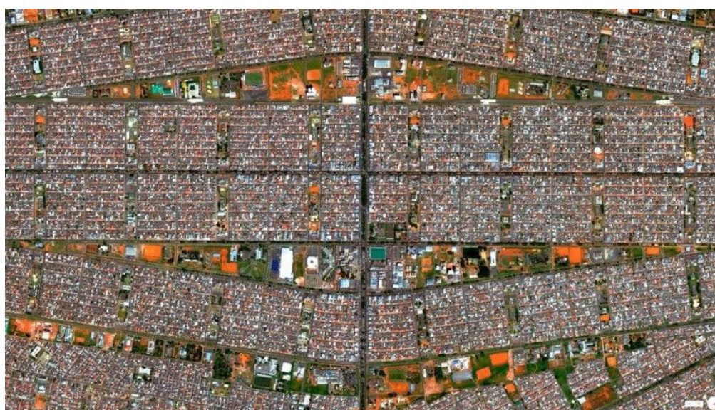
Figura 1: “Ceilândia vista sob um novo olhar”. Jornal Metrôpoles, 11/11/2015.

Sabemos que, nos fundamentos de sua concepção urbanística, Ceilândia foi construída nos início dos anos 1970 para reunir os moradores de acampamentos e aglomerações remanescentes da construção de Brasília. Ceilândia, cidade-satélite, não estava prevista no Plano Piloto de Lucio Costa. No entanto, apenas uma década após a inauguração de Brasília – simbolicamente no dia 21 de abril – as coordenadas que dariam curso ao seu crescimento estavam desenhadas: uma política de Estado de tom marcadamente segregador no que respeita à posição no território e às características que fundamentais de seus projetos urbanos. É patente que no Plano Piloto predominam espaços livres entremeados pela abundante vegetação e equipamentos públicos e coletivos; em Ceilândia, assim como em outras cidades em torno do núcleo central, predomina o tipo de urbanização caracterizado pelo loteamento, com poucas áreas privilegiadas e clara repetição nos padrões de desenho.