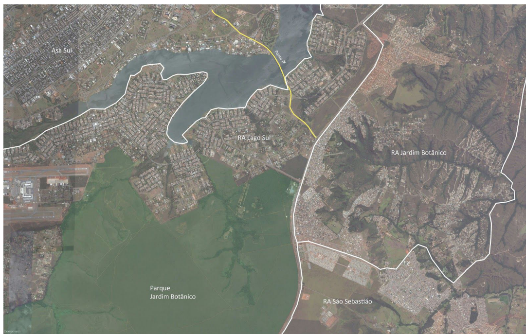
Figura 4: Localização da ponte JK.

Mesmo depois da institucionalização da RIDE/DF, o planejamento territorial, quando se deu na escala metropolitana, permaneceu pouco efetivo. Tampouco os planos municipais propuseram ou consideraram estratégias compartilhadas, o que forma, conforme Schvarsberg (2010, p. 274), “ o paradoxo do caráter da metropolização como um processo concreto e complexo, e a sua institucionalidade primária, na forma da RIDE/DF (...) como uma virtualidade”. Essa carência de estratégias compartilhadas e de leituras mais amplas sobre as dinâmicas socioeconômicas no território da RIDE/DF foi fundamental para o desencadeamento de um processo de expansão urbana dentro do DF. Analisando os planos subsequentes do DF, quais sejam, o Plano de Ocupação e Uso do Solo (POUSO), aprovado em 1990, e o Plano Diretor de Ordenamento Territorial (PDOT), aprovado em 1992, observa-se que o eixo sudoeste da capital permanece como prioritário, ao passo que houve crescimento induzido por meio de grandes infraestruturas urbanas e viárias em franca oposição às diretrizes de todos esses planos, o que direcionou a expansão urbana para o vetor sudoeste (VIANNA, 2011). A ponte JK, que liga a Região Administrativa do Lago Sul ao Plano Piloto, teve sua construção iniciada em 2000 e foi inaugurada em dezembro de 2002, alterando significativamente a acessibilidade à região posterior ao Lago Sul, incluindo os condomínios situados no Jardim Botânico (hoje uma RA) e na região do Altiplano Leste (VIANNA, 2011).