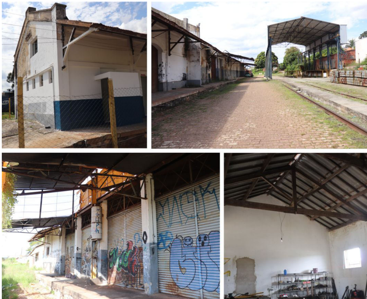
Figura 4 - Vista dos Armazéns e oficina

concessionária e ambos apresentam um bom estado de conservação, sem patologias visíveis, desgaste na pintura, problema estrutural e de cobertura. Os outros três armazéns do conjunto, foram cedidos à prefeitura desde o “Termo de cessão do direito de uso” de 2012 (ITAPETININGA, 2012), entretanto, os imóveis nunca foram utilizados.