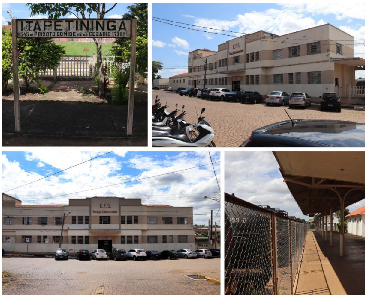
Figura 2 - Vista da atual Estação de Itapetininga (2018)

As novas funções que seguem até os dias atuais são: Fundo Social de Solidarietà no piso inferior; e Secretaria de Trânsito e Cidadania no piso superior. As principais atividades dos órgãos ocupantes do edifício são: Fundo Social, que aplica diversos cursos de capacitação, bem como, atividades de cunho sociocultural; já a Secretaria de Trânsito e Cidadania acomoda as atividades da pasta, que se enquadram em recursos de multas, cursos de condutores, planejamento viário e outras funções administrativas. É importante ressaltar, que até o ano de 2017, também, foi usada como quartel da Guarda Civil Municipal.