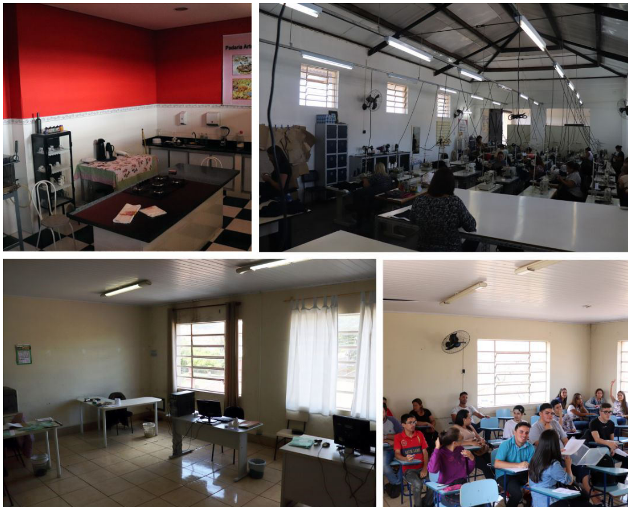
Figura 3 - Vista Interna da Estação de Itapetininga - Fundo Social e Secretaria de Trânsito e Cidadania

Entretanto, como forma de proteção e segurança do espaço, foi adicionado uma grade que impossibilita acesso ao pátio e consequentemente a linha férrea.