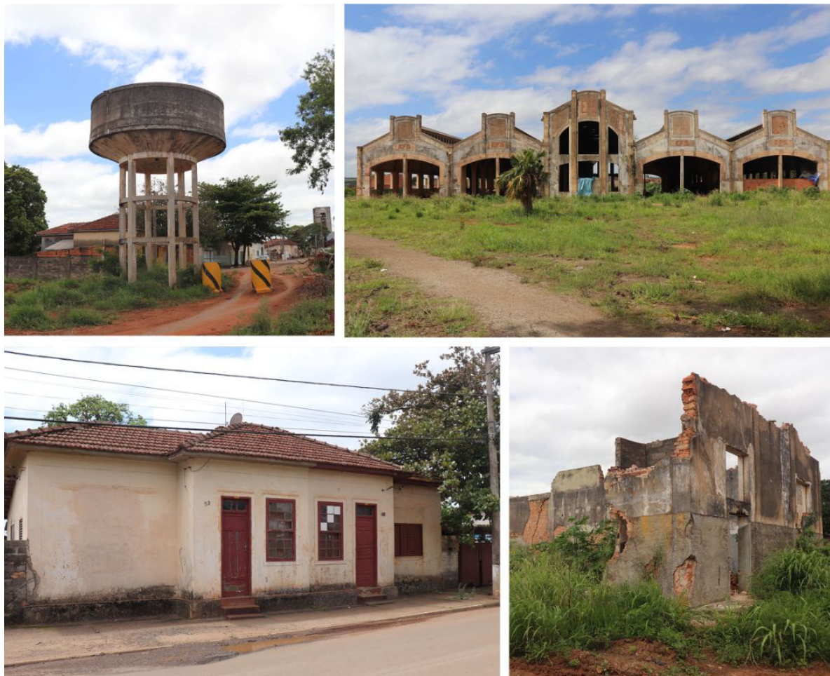
Figura 6 - Vista dos componentes do Conjunto da Oficina de Locomotivas

de sua criminalidade, circunstâncias que impõe desconforto aos habitantes do local. (ROSIM, 2012 e 2013; ZINI, 2015)