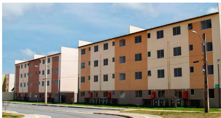
Figura 7 - Conjunto Habitacional Macapaba, Macapá/AP, 2014.