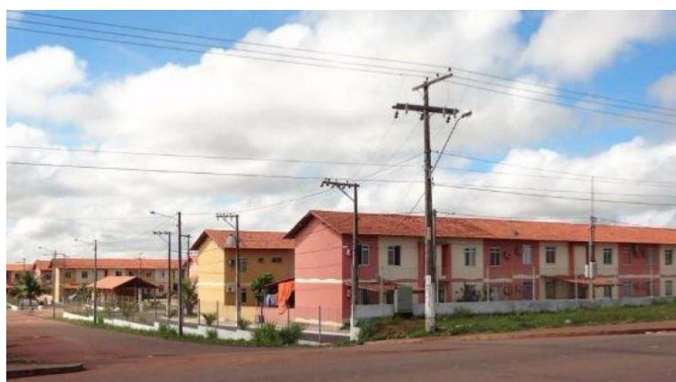
Figura 5 - Figura 04 – Conjunto Vitória-Régia, Macapá/AP, 2007.

Desse modo, o primeiro projeto habitacional que foi feito nesse período foi o Conjunto Vitória-Régia (Figura 5), que está localizado na zona norte da cidade e foi realizado pelo governo estadual de Waldez Góes no ano de 2007 por meio de recursos do PAR (CARVALHO, 2015). O empreendimento promoveu 160 unidades habitacionais de interesse social distribuídas em blocos de dois pavimentos.