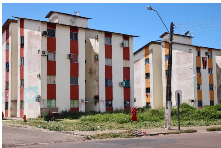
Figura 6 - Conjunto Habitacional Mucajá, Macapá/AP, 2011.

O conjunto foi realizado em uma região mais elevada e plana próxima à área da antiga ocupação e remanejou a população para 37 blocos de apartamentos de 4 pavimentos e com 4 apartamentos por andar (AZEVEDO, 2016). O projeto ofertou um total de 592 novas unidades habitacionais de interesse social e foi o único realizado totalmente com uma demanda específica, a da favela Mucajá, na cidade.