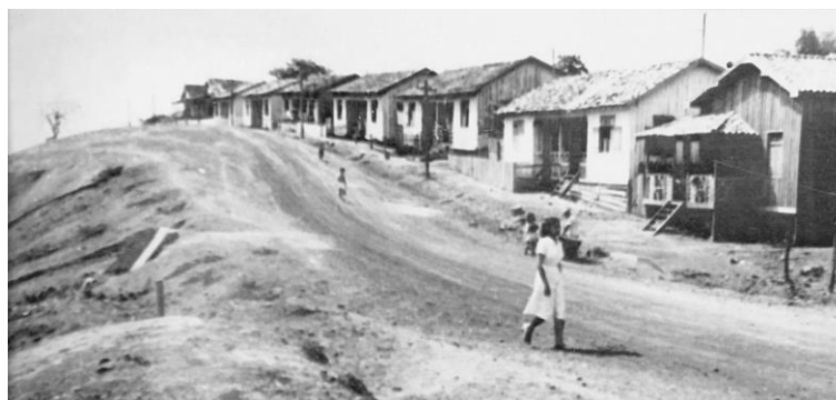
Figura 2 - Casas para servidores públicos do Território Federal do Amapá em Macapá construídas na década de 1940, av. General Gurjão, década de 1950.

Os primeiros registros fotográficos encontrados deste projeto datam de 1950 e mostram o conjunto de residências de madeira situadas em uma região denominada no período de “Bairro Alto”, aparentemente com poucas infraestruturas urbanas (Figura 2). Das demais casas que faltavam ser concluídas, o governo retomou as obras e entregou, somadas as 8, mais 7 casas no final do ano de 1944 (NUNES, 1946).