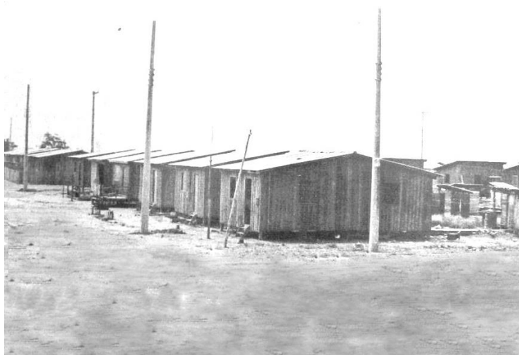
Figura 4 - Casas na Baixada do Elesbão no ano de 1983, Macapá/AP.

Uma dessas regiões a receberem esse projeto habitacional foi a antiga favela do Elesbão, onde hoje se encontra o bairro Santa Inês na orla de Macapá, como mostra a Figura 4. O governador também realizou outras obras de habitação popular na região conhecida como Baixada do Japonês, onde é hoje o bairro Perpétuo Socorro, e no bairro Novo Buritizal (PENNAFORT, 1994).