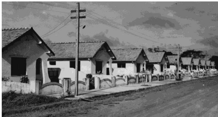
Figura 3 - Vista parcial do conjunto residencial da IPASE em Macapá (AP), av. Procópio Rola, década de 1950.

Outro projeto também realizado no final da década de 1950 é o Conjunto Residencial da IPASE, que, como mostra a Figura 3, apresenta edificações em alvenaria e melhor infraestrutura viária, com a definição de passeio público e postes de energia elétrica. Esse conjunto foi construído como uma moradia definitiva para os mesmos, ao contrário do conjunto anterior que tinha um caráter provisório.