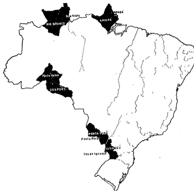
Figura 1 - Territórios Federais criados em 1943.

A partir do decreto-lei n. 5.812, de 13 de setembro de 1943, foi criado o antigo Território Federal do Amapá pelo então Presidente Getúlio Vargas, junto com os territórios do Rio Branco, do Guaporé, de Ponta Porã e do Iguazu. A criação destes foi justificada de modo a proteger as regiões fronteiriças de vazio demográfico e como forma de garantir a atuação do governo em regiões longínquas, criando assim condições jurídicas e econômicas para reorganizar o espaço brasileiro (PORTO, 2002).